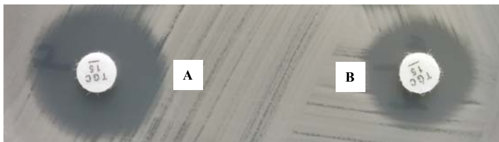
图 1. 纸片扩散法检测细菌对替加环素的敏感性

A. 含替加环素复敏液纸片（22mm）；B. 不含替加环素复敏液纸片（18mm）；